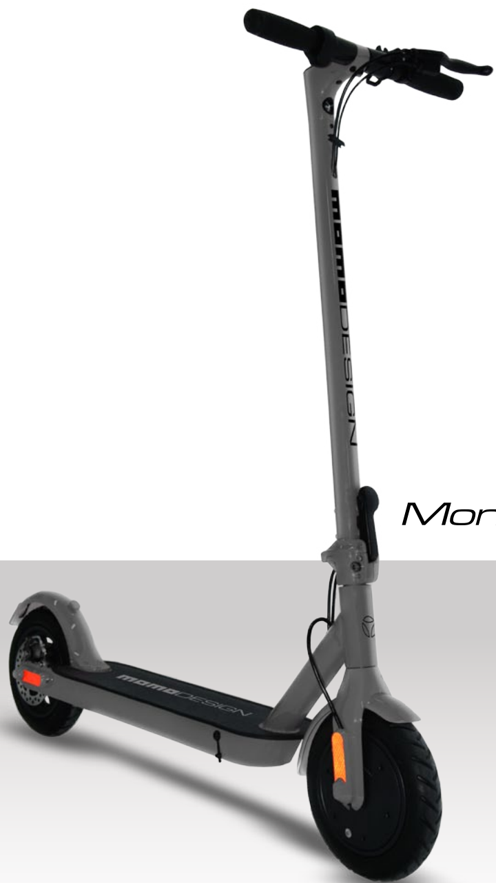
MILAN 100 Monopattino Pieghevole 10.0"